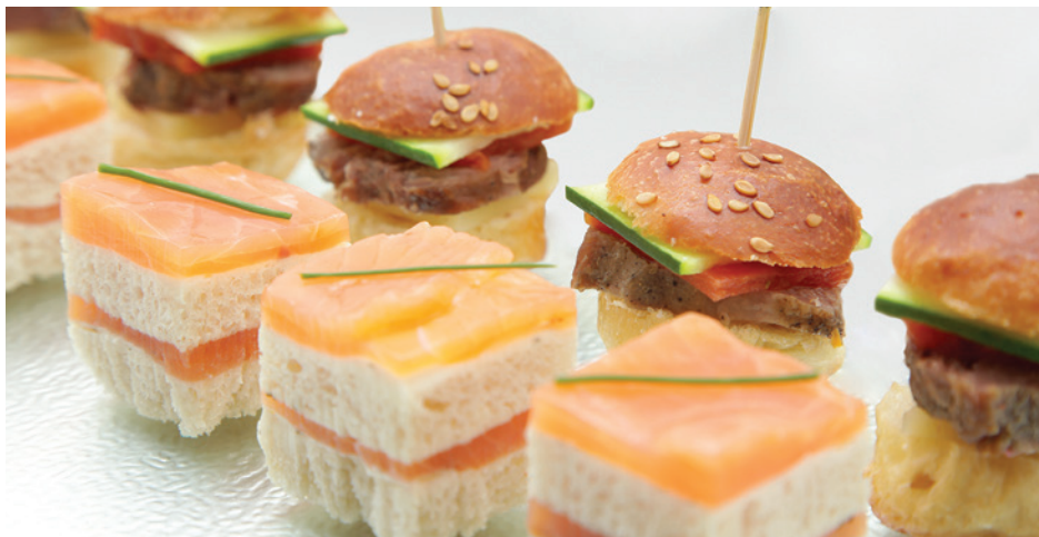
Brioché joue de porc confite, comté et tomate / Opéra saumon fumé, beurre crevette