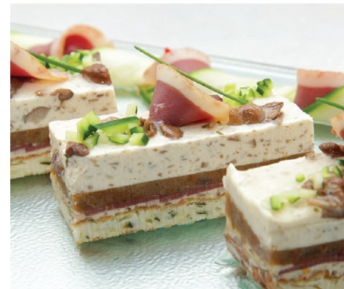
Bavarois de mousseron, magret fumé et clafoutis courgette - 5,60€