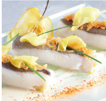
Ballotine de Saint-Pierre, onctueux céleri et pomme, sauce normande au piment d'Espelette - 10€