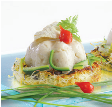
Risotto, tuile de parmesan sur galette de vermicelle - 3,80€