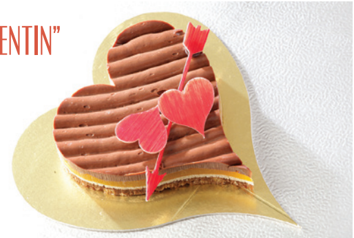
Sablé breton gourmand, crèmeux chocolat au poivre de Timut, confit de mangue et fruit de la passion - 13,90€