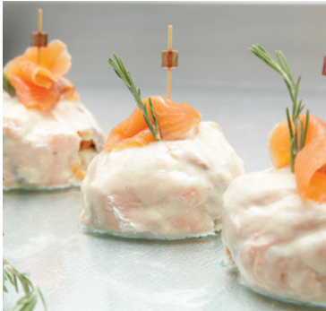
Truite saumonée en charlotte, lotte, sauce romarin - 10,20€