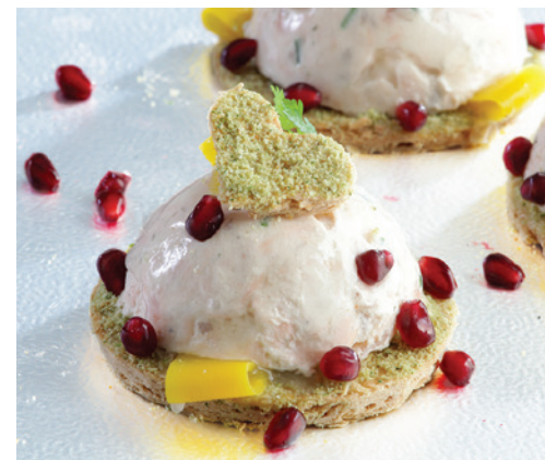
Dôme de rillettes de saumon et fond sablé - 5,60€