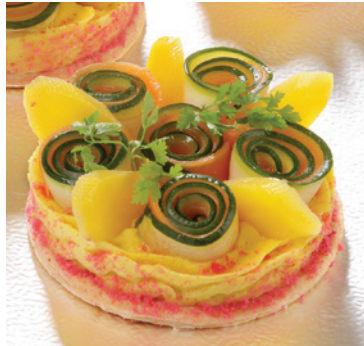
Crèmeux de carotte jaune et corolle de légumes - 3,80€