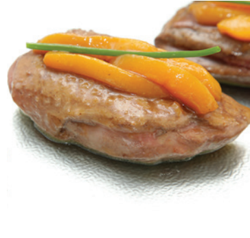
Filet de canette aux pêches - 11€