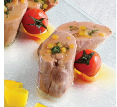
Médailon de filet mignon de porc, verdure de saison - 9,80€